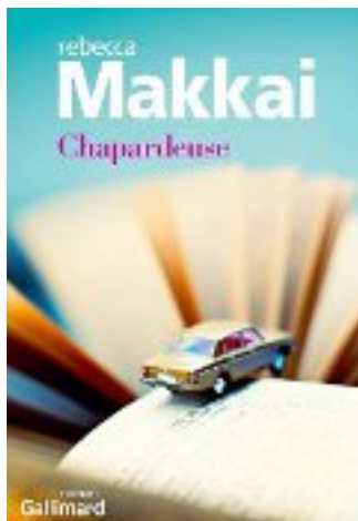
Chapardeuse de Rebecca Makkai Ed. Gallimard

Lucy, 26 ans, est bibliothécaire pour la jeunesse dans le Missouri. Sa profession l'amène à côtoyer Ian, un enfant de 10 ans, fils unique dans une famille de chrétiens fondamentalistes homophobes, qui la sollicite régulièrement pour des conseils de lecture. Les parents de Ian, craignant pour lui un penchant gay, commencent par l'obliger à ne lire que des « livres saints », « des livres qui contiennent un souffle divin ». Ils l'inscrivent ensuite dans un groupe animé par le Pasteur Bob, pour remettre « ces » enfants dans le droit chemin. Lucy va essayer d'aider l'enfant comme elle peut en fermant les yeux sur ses lectures.